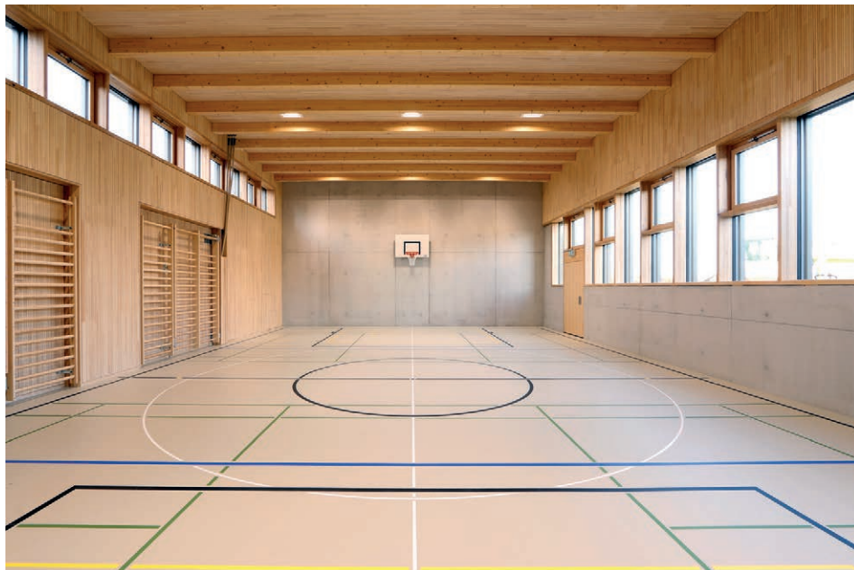
Salle de rythmique

Construction en bois Revêtements de parois en bois Plafonds en bois Amédée BERRUT SA 1868 Collombey