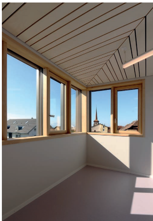
Nouvelle classe dans les combles